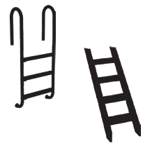
Échelle & Escalier (en option)